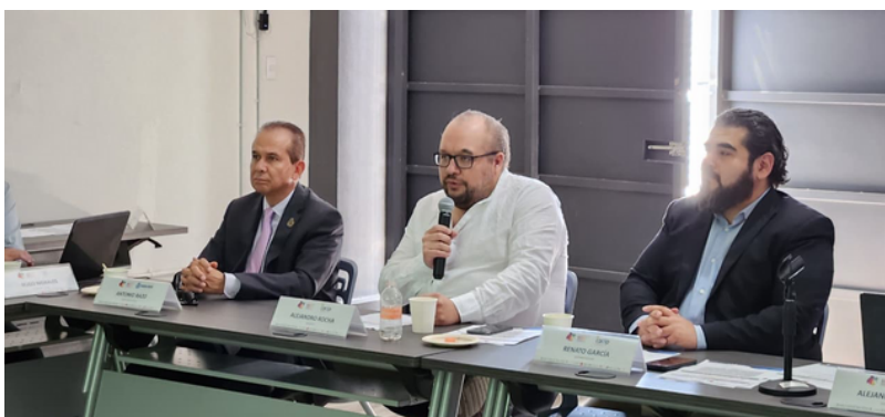
Imagen 1. Miembros del evento

“Sigamos construyendo y cocreando desde la participación de las OSC y gobierno. Estos espacios son claves para una gobernanza más inclusiva”, expresó.