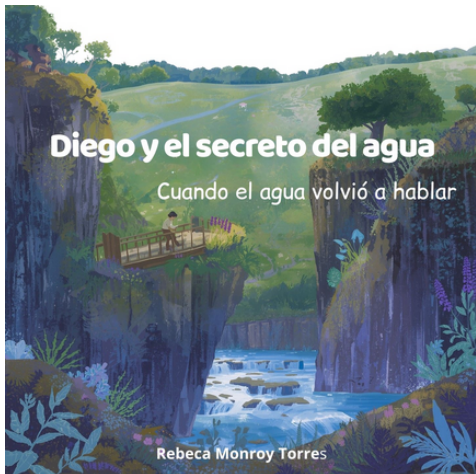
Imagen 1. Portada del libro “Diego y el secreto del agua”

Estos espacios promovidos por la Rectoría del Campus León y de la Dirección de Extensión Cultural de la Universidad de Guanajuato fomentan la creatividad y la expresión artísticas entre la comunidad universitaria y el público en general.