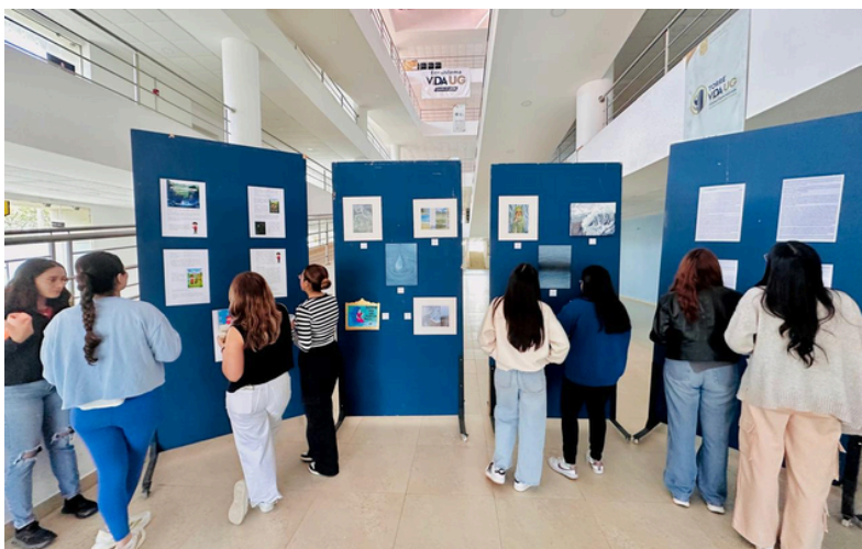
Imagen 3. Exposición cultural “los cuatro elementos”