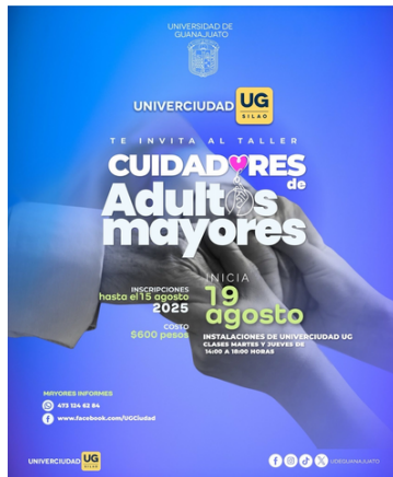
Imagen 1. Banner del evento

Las y los asistentes compartieron inquietudes relacionadas con la alimentación saludable y económica, la motivación para comer mejor, la lectura de etiquetas y los mitos sobre la nutrición. La sesión se caracterizó por el intercambio de experiencias y la generación de nuevos conocimientos prácticos para el cuidado responsable.