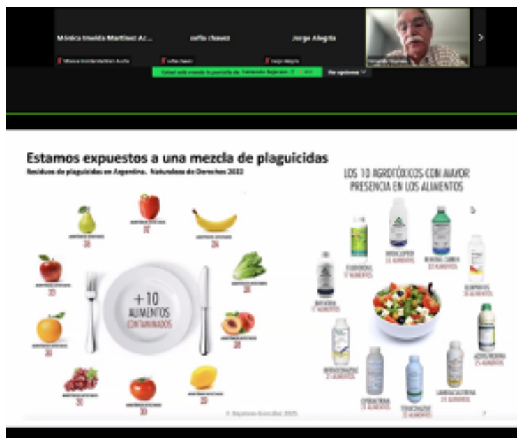
Imagen 1. Evento precongreso panel de exposición poblacional a plomo y plaguicidas.

Se agradece a las Autoridades de la Universidad Autónoma de Zacatecas, de la Universidad de Guanajuato, de Campus León y Campus Celaya Salvatierra y el mismo OUSANEZ que se logró un proyecto científico de impacto y de trabajos interinstitucionales y multidisciplinarios que coadyuven con el logro de una seguridad alimentaria y nutricional en México y el mundo.