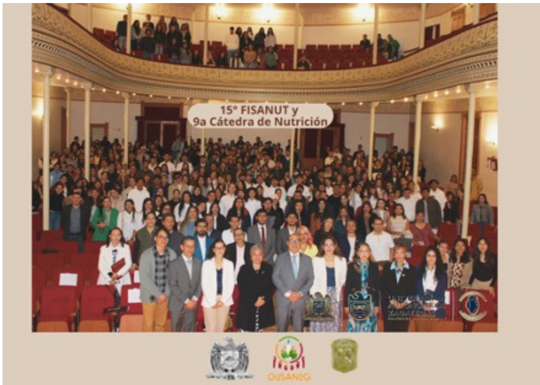
Imagen 4. Con autoridades y estudiantes de la Universidad Autónoma de Zacatecas, así como asistentes y ponentes el 9 de octubre.