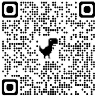
Imagen 1. Link de registro

Como conclusión de esta iniciativa, se llevará a cabo un seminario de cierre en el mes de enero de 2026, en el cual se abordarán los principales resultados, reflexiones y aprendizajes derivados de la campaña.