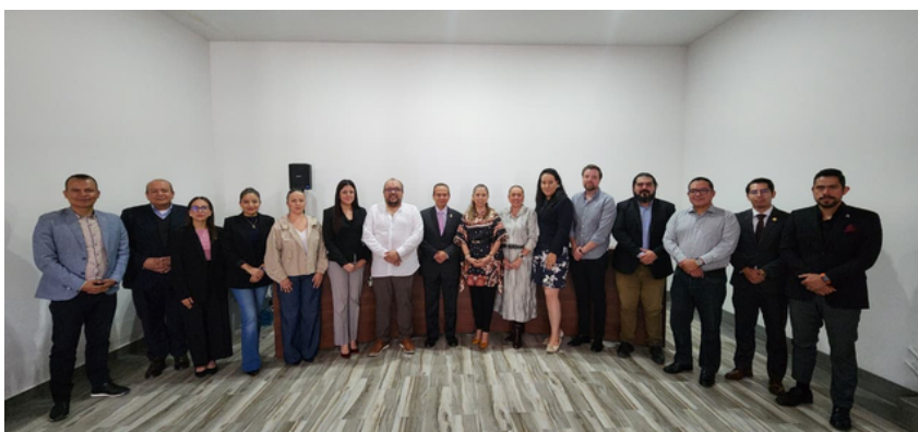
Imagen 2. Asistentes del evento