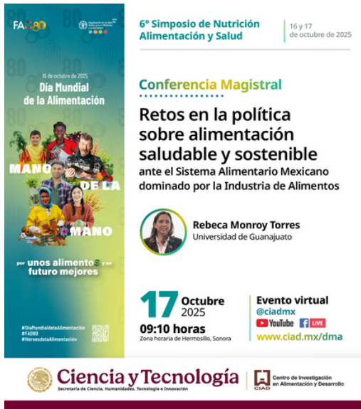
Imagen 1. Banner oficial del evento