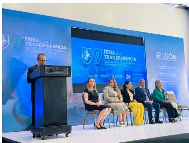
Imagen 2. Participantes del evento