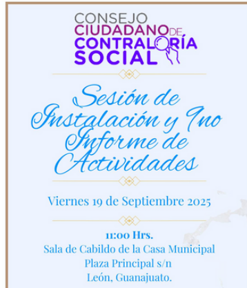
Imagen 1. Banner oficial