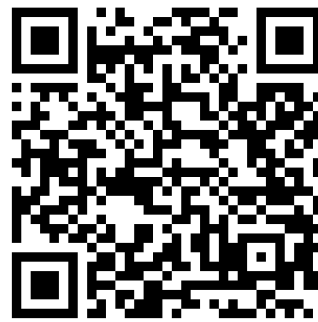
Imagen 2. Sitio oficial del evento