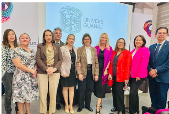
Imagen 1. Asistentes del evento