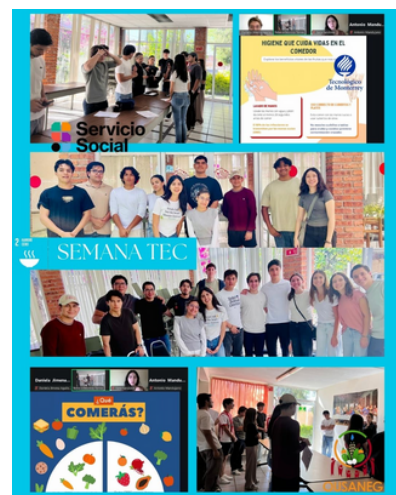
Imagen 1 y 2. Collage de las actividades realizadas en la Semana Tec con Sentido Humano