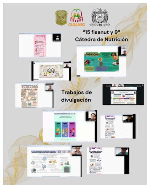
Imagen 3. Collage de los trabajos de divulgación de la ciencia