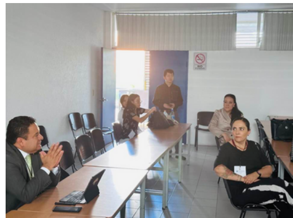
Imagen 2. Asistentes de la mesa