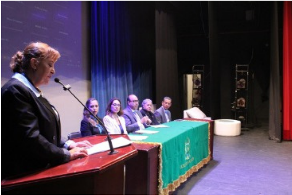
Imagen 2. Acto inaugural