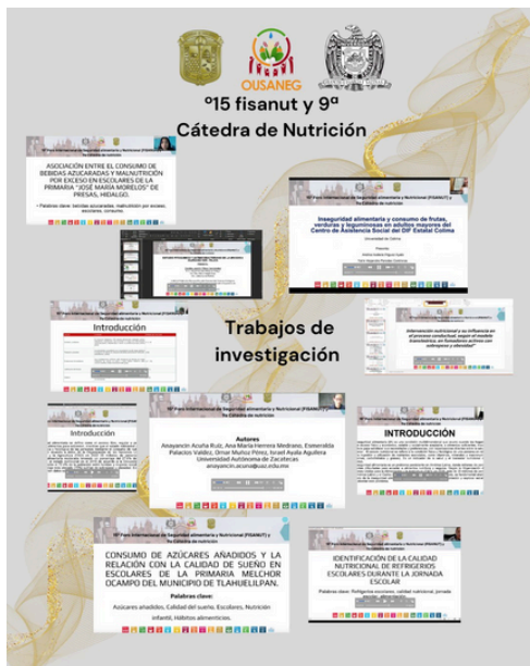
Imagen 1. Collage de los trabajos de investigación

El evento integró los concursos de trabajos de investigación, protocolos y divulgación científica, donde las y los participantes mostraron un alto nivel académico, creatividad y compromiso con la salud alimentaria. La sesiones fueron llevadas a cabo dentro de un entorno de aprendizaje y crecimiento.