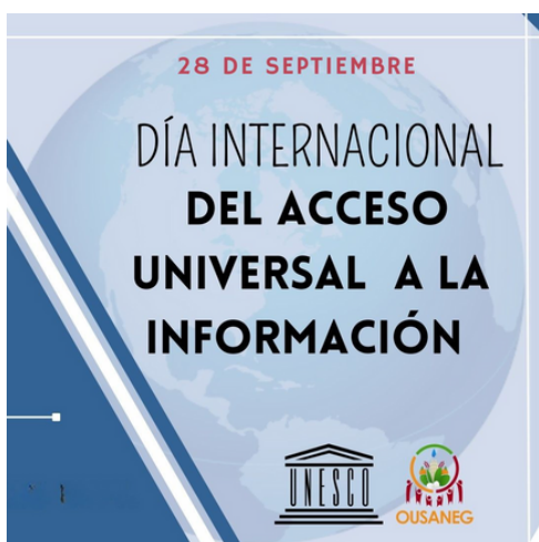
Imagen 1. Banner conmemorativo

El OUSANEG ha promovido este derecho mediante acciones de cocreación entre ciudadanía, gobierno y organismos autónomos, fortaleciendo la transparencia y la rendición de cuentas.