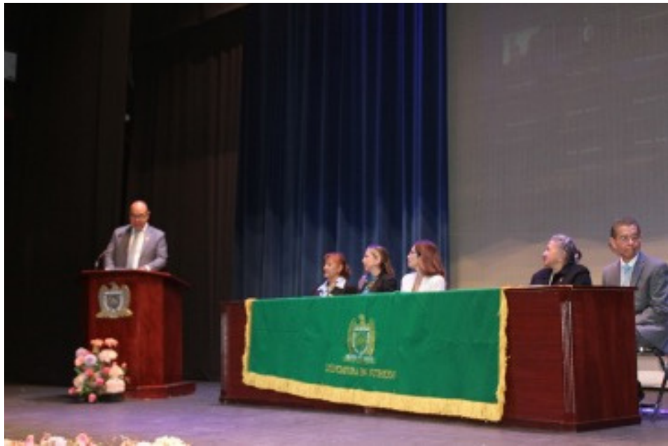
Imagen 3. Acto inaugural