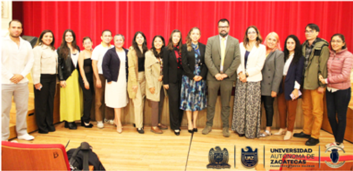
Imagen 6. Foto grupal del comité organizador del 15º FISANUT y 9ª Cátedra de nutrición.

Aquí los enlaces de las grabaciones de los días 9 y 10 de octubre.