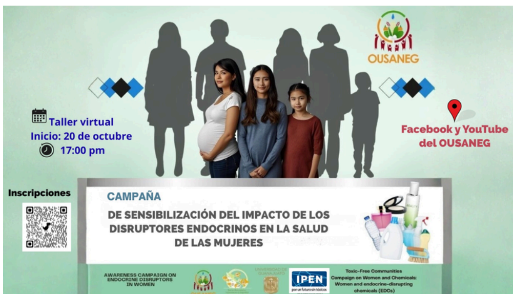
Imagen 1. Banner oficial de la campaña

El 25 de octubre del presente año, el OUSANEG , en colaboración con The International Pollutants Elimination Network (IPEN) y como aliada la Universidad de Guanajuato , lanzó el Curso-Taller Virtual “Disruptores Endocrinos: Efectos en la Salud de las Mujeres” . El programa busca sensibilizar y capacitar principalmente a las mujeres, sobre la exposición cotidiana a compuestos químicos que alteran la función hormonal y que están presentes en productos como cosméticos, plásticos, textiles y pesticidas.