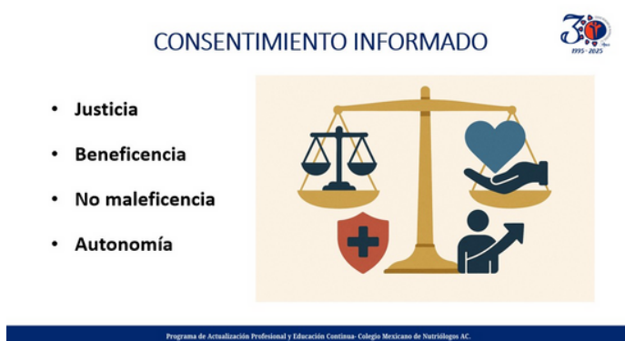
Imagen 3. Presentación de la Dra. Rebeca Monroy Torres