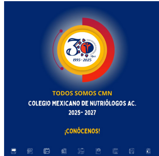
Imagen 1. Banner Colegio Mexicano de Nutriólogos A.C.