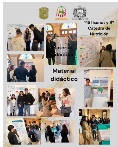
Imagen 2. Collage de los trabajos de material didáctico